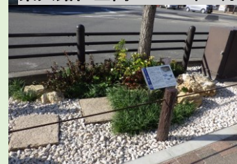
東大路仁王門 2023年3月