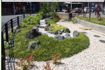
四条堀川北西角 2020年3月